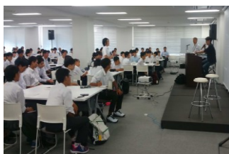
ワークショップ後の質疑応答