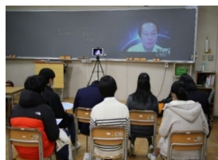
オンライン少人数議論