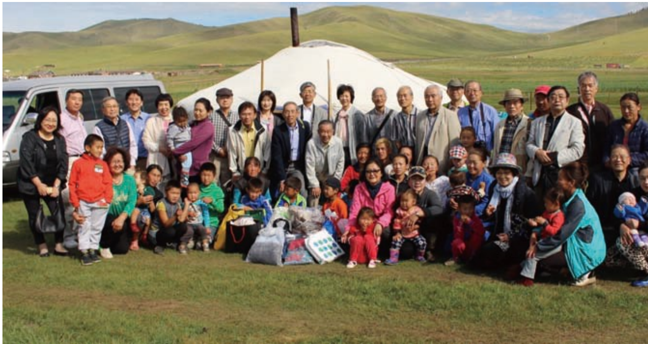
チャツアルガン村母子家庭施設を訪問・文房具を寄贈

ダイレクトフォース設立15周年記念で実施された 「モンゴル視察6日間の旅」に参加した会員からの発案でスタート。