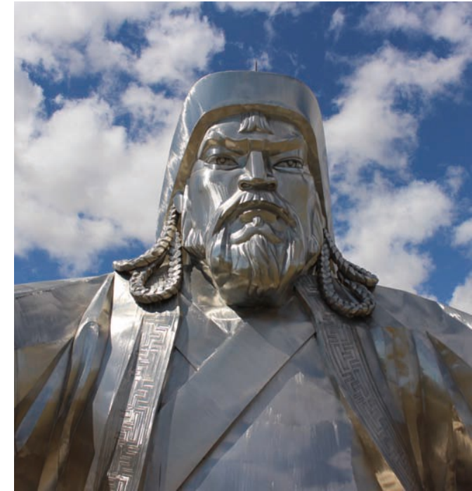
チンギスハーン巨像