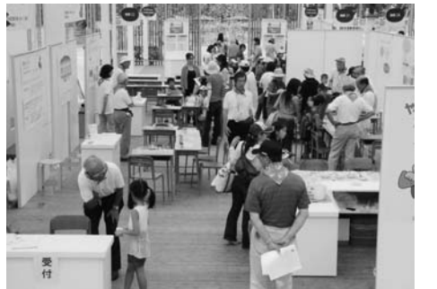
会場には子供達が一杯

親子に人気があったのは表れづくりで、発泡スチロールに絵の具で書いた文字が、加熱することで文字の周辺が溶解し、文字があたかも浮き上がる効果に驚き、喜んで持ち帰っていました。 初日の19日の実験参加小学生は111人へのほり、24日とあわせ3000人を超え、予想を超える入場者数で実験資材が足りなくなるほどでした。 会員の皆さんはフル回転の活躍で全員充実感に満たされた2日間でした。