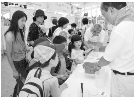
身乗り出して見る子供達

8月19日、24日の両日、会場はズーラシア（横浜動物園）ヒルサイドエリアのサイエンス広場でした。 子供たちが化学実験と科学マジックショーを体験し、驚きや感動を味わうことよって、科学への興味と関心を