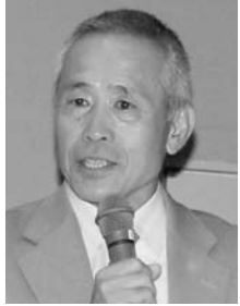
塚本勝巳氏 東京大学 海洋研究所教授