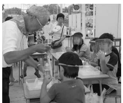
先生役が板に付く

になれば幸いです。 なお、横浜開港150周年記念イベントでは、会場の管理監督業務のためボランティア活動に35人のDF会員が参加し手伝いをしました。