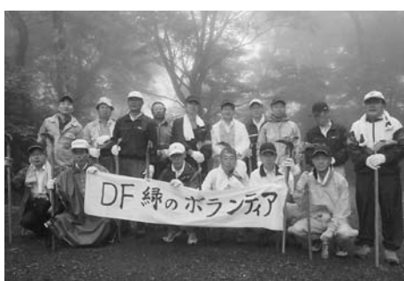
仕事を前に張り切る皆様