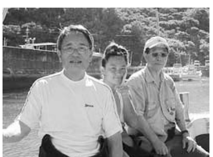
ガイドのギャルといっしょに