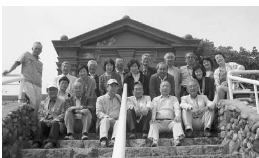
山梨サントリー登美の丘ワイナリー前にて