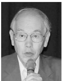
村上和雄氏 筑波大学 名誉教授