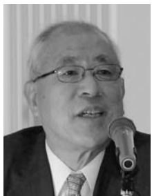
出原洋三氏 日本板硝子株式会社 取締役会議長