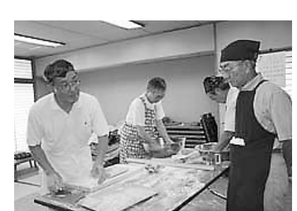
美味しい蕎麦打ちに奮戦する会員