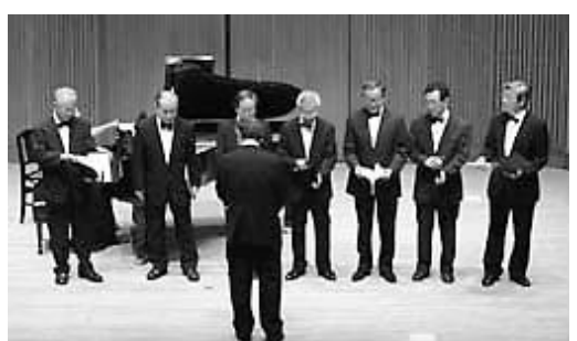
大泉学園夢ありホールでの発表会