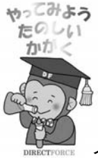
イベントのキャラクター

横浜開港150周年の記念イベントに協賛し、技術部会員の皆さんが小学生理科実験教室を開きました。